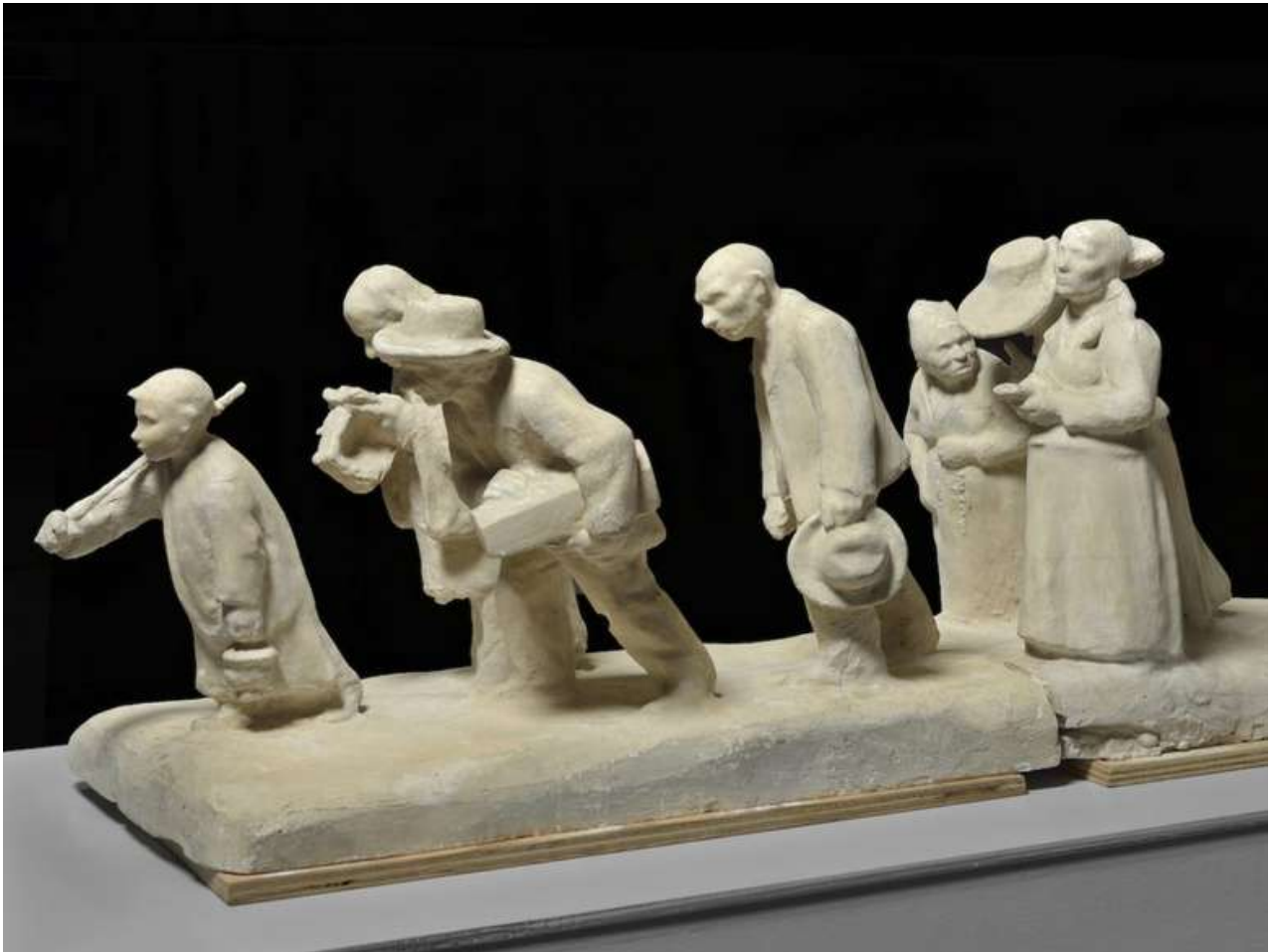
'L'enterrement d'un enfant en Périgord', sculpture de Jane Poupelet, 1904