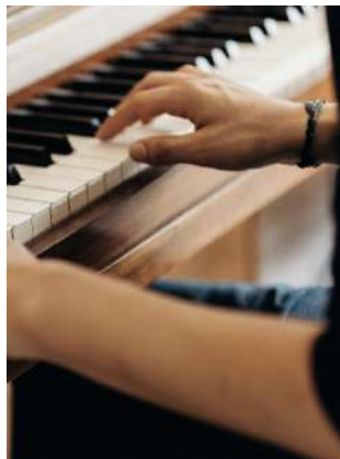
élèves pianistes du conservatoire de Dordogne