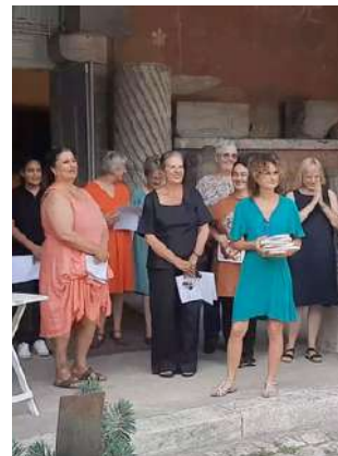
Atelier d'Ecrit de Femmes solidaires